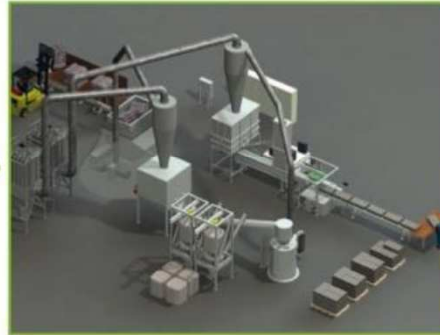
20 points de contrôle en usine